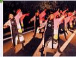
よさこいよっちゃばれ祭り