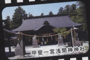
甲斐一宮浅間神社