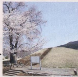
おかちやうしづか 岡銚子塚古墳