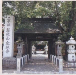
じょうりんじ ふたごづか 恵光山定林寺(二子塚)