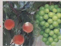
桃狩り・ぶどう狩り※