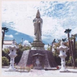
じしやうじ 天真山自性寺